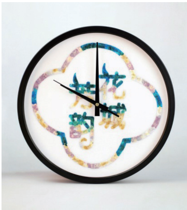
>图3 “花城芳韵”押花艺术时钟设计