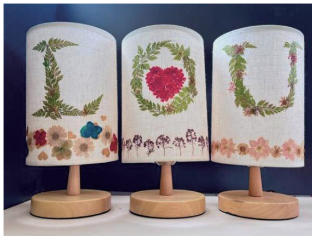
>图1 “LOVE”押花艺术台灯系列设计

时钟是一种计时工具，它让人们能更好地进行时间管理，也为人们的生活带来了极大的便利性，使之成为我们日常生活的必需品。所以古往今来的时钟设计，可以说是丰富多彩、五花八门，有实用性具有艺术性。那如何将押花元素与时钟相结合呢？我们押花文创设计小组在进行“花城芳韵”押花主题文创产品设计时，选取了几种广州花城比较有代表性的花卉将之运用到文创产品上，从文