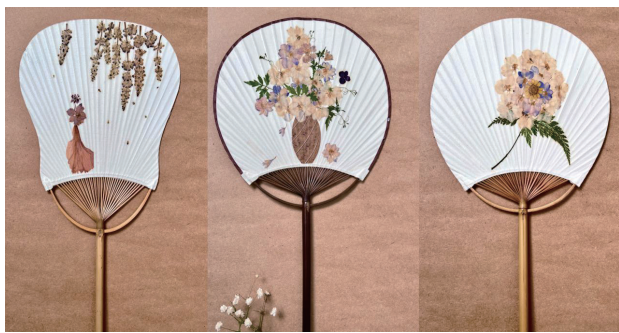
>图5 押花艺术团扇系列设计

和叶的不同色彩与形态，经过巧妙构思后，重新组合成具象的物品，并让人觉得是浑然天成。而制作“花瓶与花”押花扇时，则是将叶片裁剪成花瓶形状，朵朵花束组合成插花造型，形成一幅美丽的静物画，温馨而恬静。制作其他押花扇时也会根据花材的形状、大小、颜色设计出新颖的图案，因为每一片花叶都是独一无二的，通过想象与创造就能将这些自然的美永恒定格，成为赏心悦目的艺术实用品。