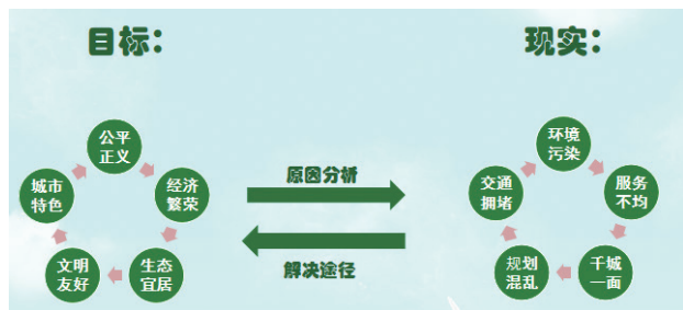
> 图1:《市政学》教学创新的缘起