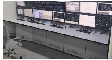
图1 高铁行车指挥科普体验平台现场图

扩充系统中的突发事件场景，采用3D虚拟建模技术等还原轨道电路、信号机设备、道岔等到调度中心的现场场景 [5] 。在可视化系统界面中嵌入更加趣味和直观的适应性测试科普版，包括基本认知能力测试体验、心理品质测评技术体验、微表情同步反馈、生理信号（脑电、心电、皮肤电）技术体验，使用公众更为接纳的科普性语言，增强科普体验性，感受高铁调度员在应急处置工作中的心理和生理状态变化 [6] 。科普受众还能从安全管理角度认识到，高铁调度员作业安全适应性选拔测评和定期测评的实施，可以大大降低其后期培训、管理成本，减少人因事故发生。科普体验平台实体如下图1所示。