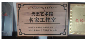
图2 授予荣誉称号标签