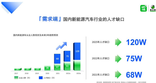
图2-1 国内新能源汽车行业人才缺口

2025年，中国新能源汽车行业迎来关键转折点，新能源汽车领域专业人才缺口将达120万。车企的竞争已从产品、技术延伸至人才生态。汽车企业及国内百强零部件企业都将调整人才结构、优化组织架构列为最高优先级，解决根据用工高峰灵活且周期性稳定补充蓝领劳动力的问题，成为各大企业在今后几年亟需争抢的战略高地 [5] 。