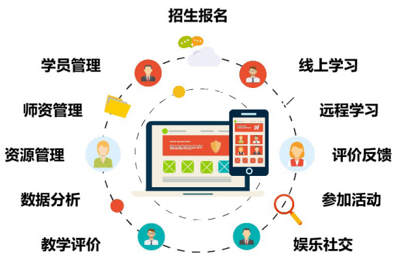
图3：OMO智慧助老服务体系图

丰台区老年大学构建“数智助老服务体系”，自主研发老年教育社交平台及数字化程序，引领“互联网+老年教育”融合创新。平台集成报名缴费、教学管理、资源调度、选课学习、远程交互等全流程数字化场景。截至2024年，平台注册用户达13,715人（年服务量14,343人次），总浏览量超4.2万次；在籍学员3,900人，规模稳居北京市区属老年大学前列。