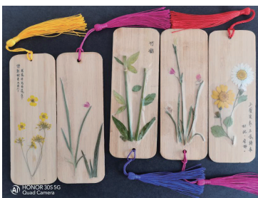
图4 中式插花风格书签 - 兰、菊、竹