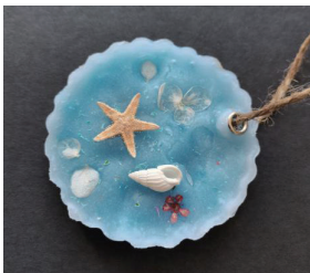
图7 母亲节爱的礼物 - 植物精油香薰蜡片 海韵

压花艺术课程是一门融合了植物学、操作技艺、文化艺术的综合性交叉学科，对教师的综合素质要求极高，笔者虽为生物学科的研究生，有过植物标本馆建设的经验，也努力自学了许多关于美术构图、色彩搭配及中国传统文化的知识，但是还不能完全满足本门课程对教师压花技术新工艺的掌握、压花艺术鉴赏力的提升的全部要求，特别是压花艺术在花艺行业的应用实战经验还需进一步强化。