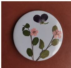
图6 压花用品镜子 - 蝶恋花