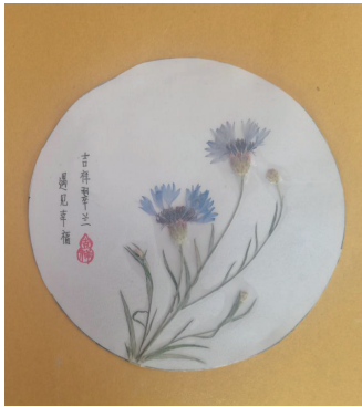
图1 中式插花风格压花画 - 遇见幸福

展美植压花坊、创意标本工作室、童趣压花材料包项目等开展创新创业项目的比赛，获自治区三等奖两项。