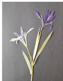
图3 中式插花风格压花画 - 兰