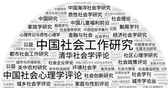
图1 社科文献出版集刊主题词云

截至2024年底,社会科学文献出版社已出版社会学类学术集刊37种(见图1),涵盖社会学、社会工作、社会政策与社会保障、民族学与人类学、社会心理学等学科。社会科学文献出版社主办了共十一届人文社会科学集刊年会,已然初步形成了以集刊为纽带的共享资源、共创机遇、共促发展的社会学学术共同体。共同体内部不同集刊之间的交流互动、思想碰撞,融合形成学术合力,为社会学自主知识体系建构提供了重要的支持。