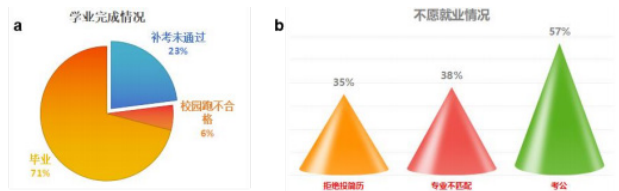
图1 (a) 学生学业完成情况和 (b) 学生不愿就业情况

在塔里木大学生命科学与技术学院2025届324名毕业生中，延期毕业及就业方面存在不同群体特征。学业拖延群体方面，23%的学生因课程补考未通过而延期毕业，其中6%的学生是由于校园跑未达到规定标准，全院约35%的学生呈现消极怠惰心理，缺乏学习动力和进取心。心理危机群体中，有1.2%的学生被确定为重点关注对象，存在睡眠障碍、无心学习且拒绝与老师和同学交流的状况。就业困境群体表现多样，约21%的学生拒绝投递简历，对未来职业发展感到迷茫；38%的学生认为岗位与专业不匹配，不愿到与专业无关的单位就业；57%的学生一心专注于考研考公，甚至宁愿选择二战也不考虑就业（图1）。