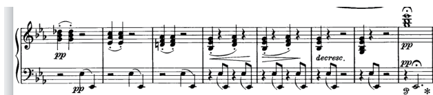
谱例9: 第一乐章 第三部分 (81-88)

这一部分是第一部分的重复再现, 主歌谣曲式第二次再现, 需要注意上下声部的移动, 交换与变化, 旋律在次中音声部, 要及时调整音乐走向。高低音声部的对位应弹的很有表现力, 高音声部具有主导声部的意义。速度直到最后也不要改变, 这是贝多芬作品中常遇到的。