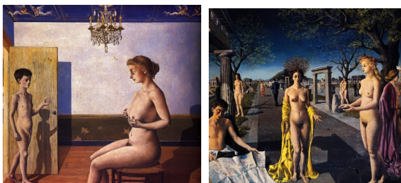
图3 访问 1939年 图4 城市的入口 1940年

弗洛伊德提出性生活并非只是在青春期才开始，而是开始于出生后不久的那些单纯表现。有必要在“性欲”与“生殖”的概念之间作出清晰的区分，前者是更宽泛的概念，而且包含了很多生殖无关的活动。性生活包括了从一些身体区域获得快乐的功能，此种功能随后开始服务于繁殖，通常，这两种功能都是无法完全一致的。 [2]