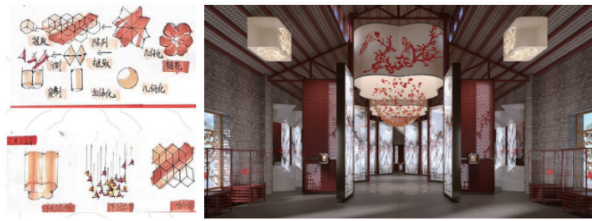
图3设计主题“一剪梅”——自绘

素进行分解重构，形成空间中心主题艺术装置，营造具有文化性的精神场所，促进代际间的情感融合 [8] 。